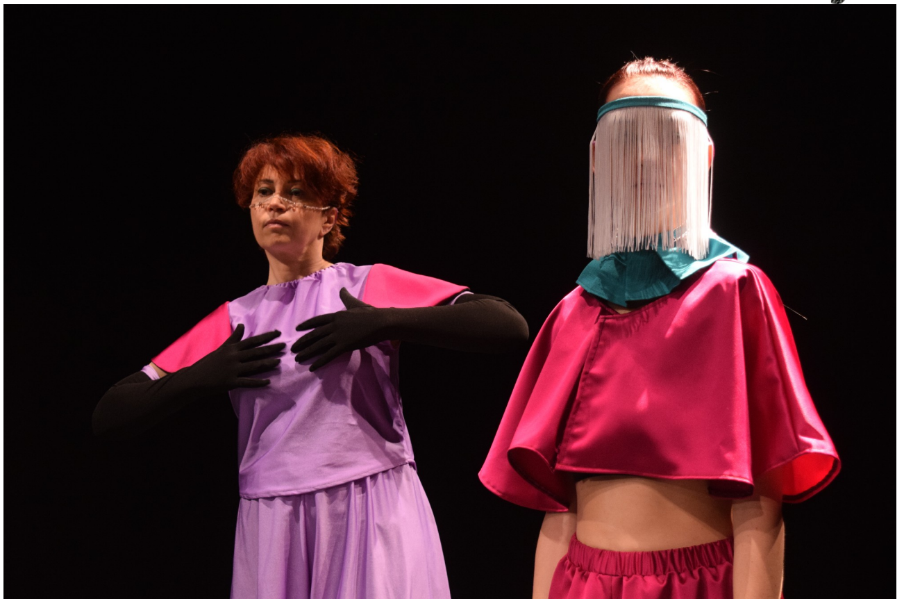
Sottocoppa , chorégraphie, décor et costumes, 2022. Boom'Structur, Pôle Chorégraphique (63)