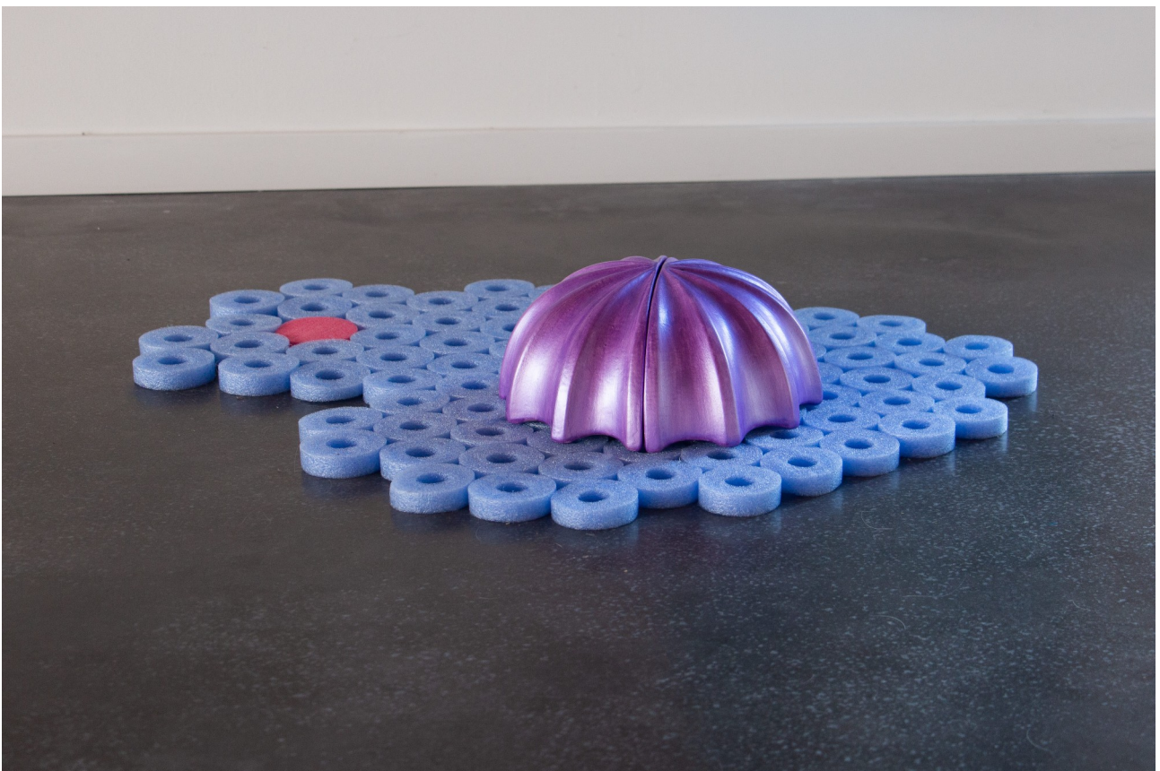
Au revoir toi , Peinture acrylique sur tissu, voile imprimé, crochets, bracelets en perles, breloques, barrettes, tourillons : 200 x 190 cm; deux tapis de frites cousues, boule de buis, pompom, céramique et pâte à modeler, peinture, dimensions variables, 2022. le basculeur (38)