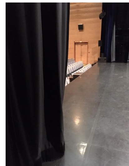
1ère coulisse cour