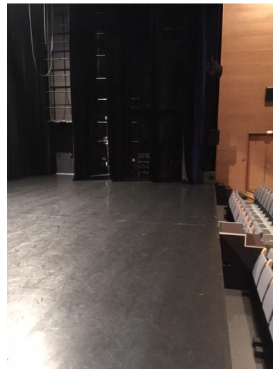
1ère coulisse jardin

La configuration salle/scène entraîne des découvertes avec les places aux extrémités des 1 ers rangs. Nous avertir à l'avance s'il faut condamner des places.