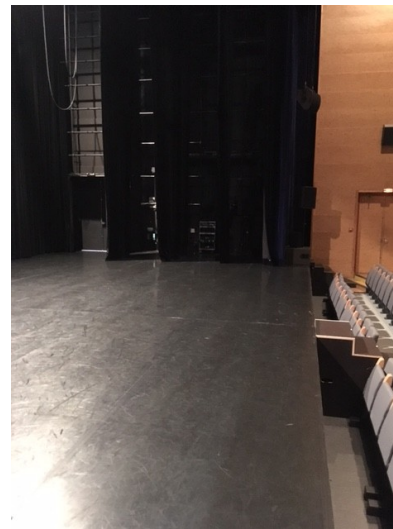
1ère coulisse jardin

La configuration salle/scène entraîne des découvertes avec les places aux extrémités des 1 ers rangs. Nous avertir à l'avance s'il faut condamner des places.